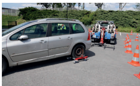
Déplacement d'un véhicule, type fourrière