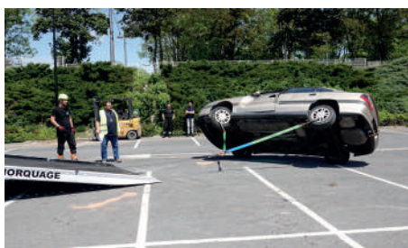
Chargement d'un véhicule sur le toit

Pour cette 2ème édition, les règles sont restées inchangées : les participants devaient concourir à travers 3 ateliers supervisés par les membres du jury, composé des gagnants de l'année dernière et de membres actifs de l'ADAF. Ils étaient jugés, entre autres, sur leur rapidité d'exécution, l'utilisation des équipements et la notion de sécurité.